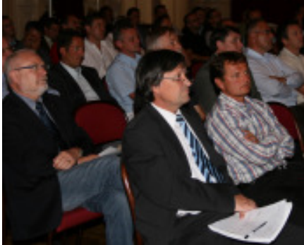
Zahlreiche Teilnehmer folgten am 2. Oktober dem Expertenforum Beton im Linzer Palais Kaufmännischer Verein.