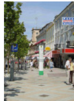
Ein erfolgreiches Beispiel zeitgemäßer Gestaltung des öffentlichen Raums mit Betonsteinpflaster ist das Zentrum von Bad Hall. Dafür erhielt die Kommune 2002 den „Crossing Borders-Mobilitätspreis“.

Bitte fordern Sie die gewünschten Bilder per Telefon, Fax oder e-mail an: Tel +43-1-904 21 55, Fax +43-1-904 21 55-11 e mail: office@bauenwohnenimmobilien.at